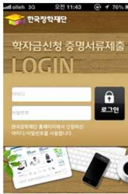
① 한국장학재단 학자금서류제출 앱 설치