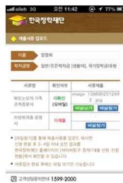
⑤ 파일 정상 등록 확인

○ 모바일 업로드 : [한국장학재단 학자금 서류제출 앱다운]-[로그인]-[파일찾기] 클릭 후 파일 업로드