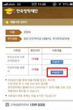
② 해당증명서 파일찾기 선택