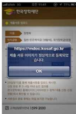
④ 파일 등록 완료