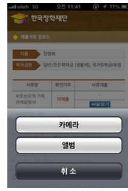
③ 파일업로드 진행